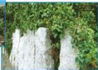
pierres debout : mein zao